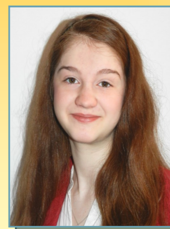
CHIRCU CRISTIANA RELIGIE ORTODOXĂ