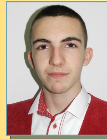
IFRIM FELIX TIC & ACADNET